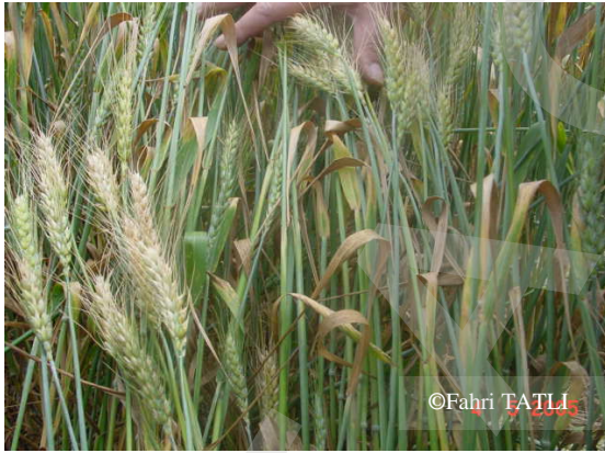
Şekil 7. Fusarium spp.'nin başaklardaki zararı.