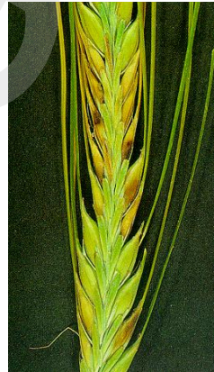
Şekil 8. Bipolaris sorokiniana 'nın başaktaki zararı.