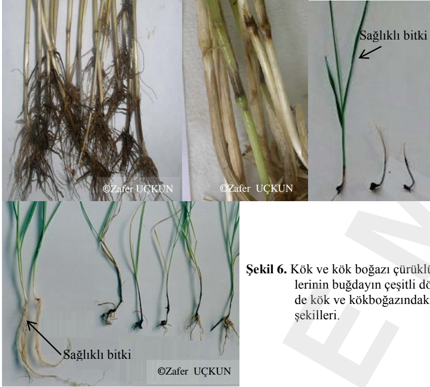
Şekil 6. Kök ve kök boğazı çürüklük etmenlerinin buğdayın çeşitli dönemlerinde kök ve kökboğazındaki zarar şekilleri.