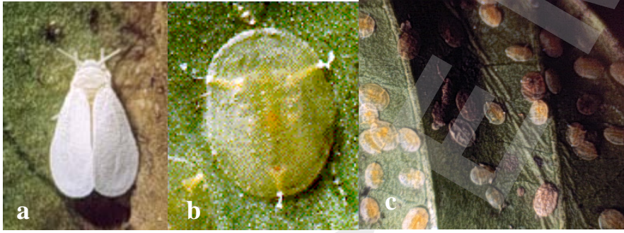
Şekil 50. Turunçgil beyazsineği ergini (a), larvası (b) ve yaprak altında beslenen larvalar (c).

Erginler süt beyaz renkli, 1.0–1.5 mm boylu küçük kelebekleri andırır. Dişilerde kanatlar erkeklere oranla daha geniş ve uzun, erkeklerde abdomen dişilere oranla daha sivri ve incedir. Yumurtaları saydam, soluk sarı renklidir. Larvalar kabuklu bitleri andırır şekilde yassı ve yaprağın alt yüzünde sabitleşmiş bir konumda olup saydam, soluk yeşil-sarımsı renktedir (Şekil 50).