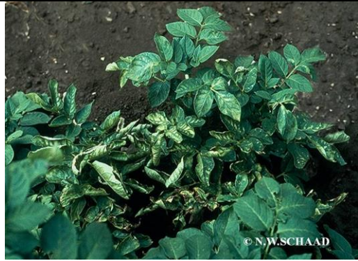
Şekil 1. Yeşil aksamda solgunluk, yaprak kenarlarında kıvrılma, damarlar arasına sararma ve nekrozlar

Ülkemizde ilk tespit Kayseri ilinde yapılmış ve eradikasyon çalışmaları devam etmektedir.