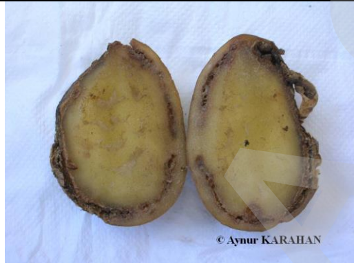
Şekil 3. İletim demetlerindeki ilerlemiş belirti