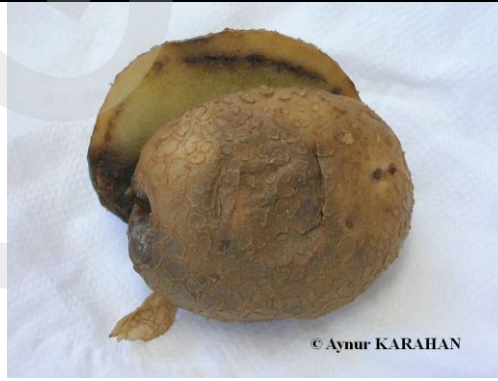
Şekil 4. Yumru kabuğunda oluşan çatlaklar